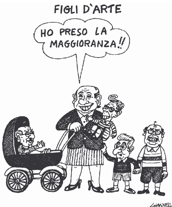
Le vignette di Forattini e Giannelli tratte da "La Stampa" e "Il Corriere della sera"

Mettere in atto politiche di regolarizzazione, inserimento sociale, uguaglianza