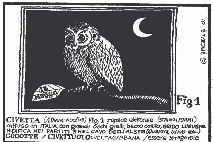
CIVETTA ( Athene noctua ) Fig.1 rapace elettorale (STRINGI FORMI) diffuso in ITALIA, con grandi occhi gialli, becco corto, GRIDO LUSUBRE NIDIFICA NEI PARTITI E NEL CAVO DEGLI ALBERI (QUERCIA, ULIVO etc.) COCOTTE ~ CIVETTUOLO: VOLTAGABBANA / essere spregevole